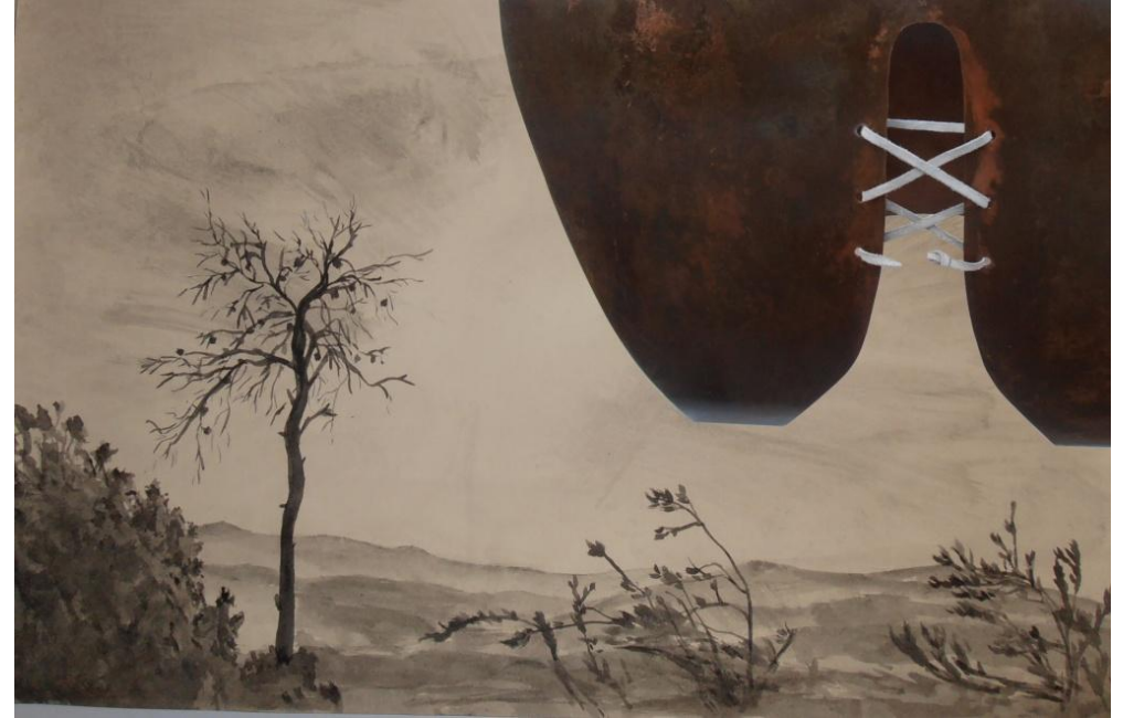
Benito Marín Montalvo

Exposición: Escultura- Instalación Del 4 al 20 de Agosto de 2013 Edificio Cultural "La Cisterna", Vilamarxant